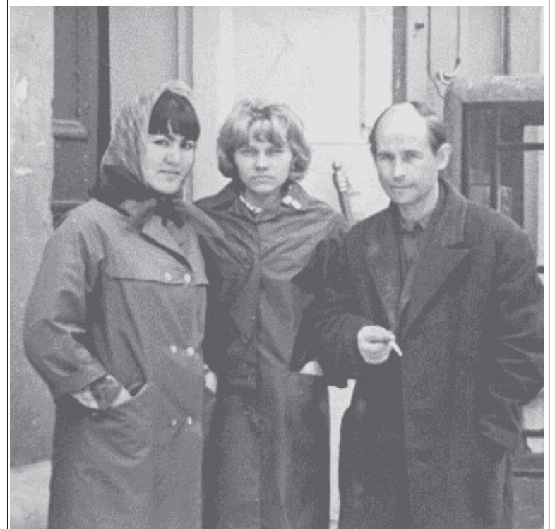
Литературный институт им. А.М. Горького: Николай Рубцов с сокурсницами.