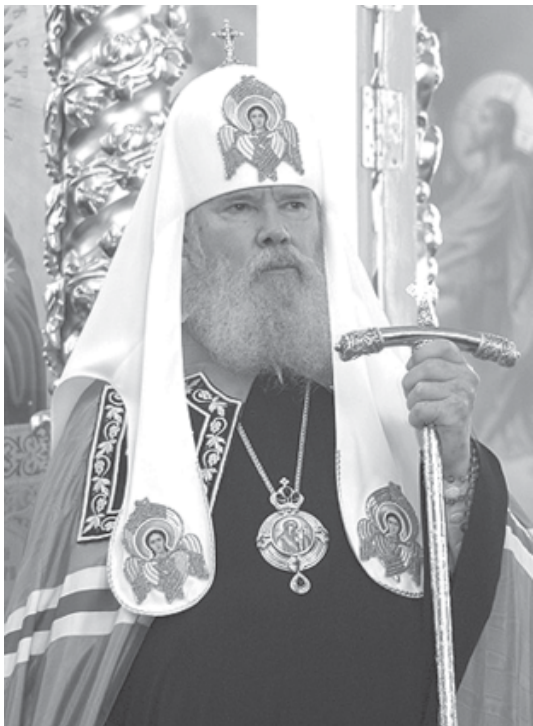
Уважаемые участники и гости Соборной встречи!

«Слово ваше да будет всегда с благодатию...»