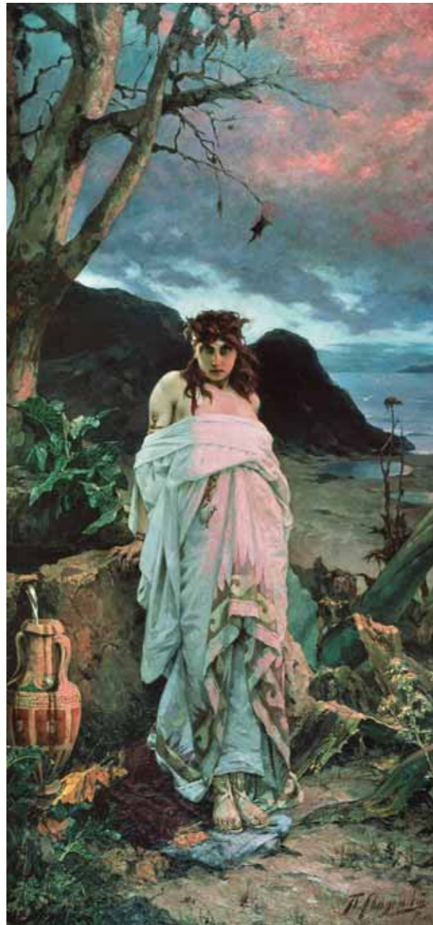
П.А.СВЕДОМСКИЙ Медуза . 1882 Холст, масло 279,2×137 ГТГ

Безусловно, академизм и салон – интернациональные явления. Но при общем совпадении жанровой и тематической структуры русского академизма с европейским у нас были свои национальные особенности. К ним следует отнести обильную продукцию в так называемом «русском стиле» – бесконечные сцены из «боярского быта XVII века», портреты девушек в кокошниках и сарафанах (К.Маковский, К.Лебедев, К.Вениг). В жанре пейзажа можно выделить в особую группу виды Крыма и его царских резиденций. Г.Кондратенко, И.Крачковский, И.Айвазовский, Л.Лагорио культивировали в своих пейзажах мифологию Крыма как «земного рая». Многие художники, имевшие польские корни (Г.Семирадский, С.Бакалович, В.Котарбинский, С.Хлебковский, И.Миодушевский и др.), участвовали в формировании русского академизма второй половины XIX – начала XX века. Волей исторической судьбы они принадлежат теперь как к польской, так и к русской культуре – все учились в петербургской Академии художеств, участвовали в академических выставках, их произведения хранятся в музеях России. То же самое можно сказать и о прибалтийских немцах – Ф.Моллере, К.Гуне, Й.Келере, Ю.Клевере, Е.Дюкере. Напомним, что русское искусство XIX века развивалось в противостоянии и одновременно взаимовлиянии двух ведущих направлений – реалистического и академического. Во второй половине XIX столетия они стали основой для создания художественных ор-