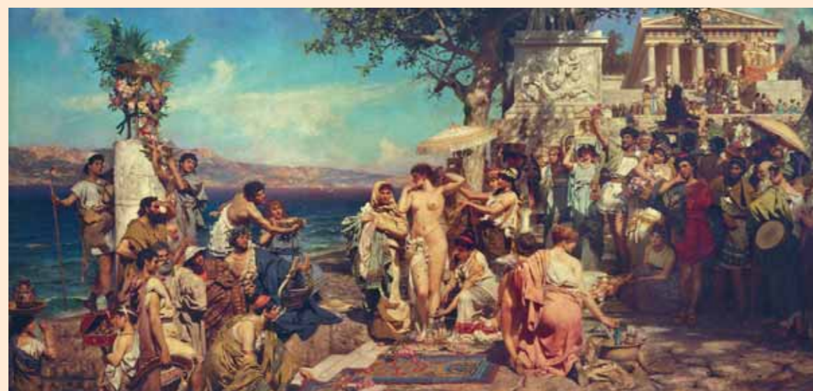
Г.И.СМИРАДСКИЙ Фрина на празднике Посейдона в Элевзине 1889 Холст, масло. 390×763,5 ГРМ

The Tretyakov Gallery thanks 'SeverStal' and 'British American Tobacco Russia' for their financial support in the organization of this exhibition.