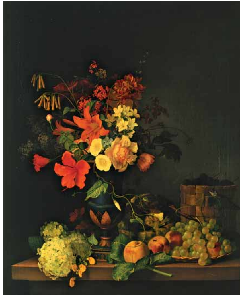
Ф.Г.ТОРОПОВ Натюрморт. Цветы и плоды 1846 Холст, масло 88,4×70,5 ГТГ