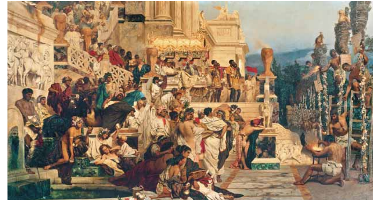
Авторское повторение одноименной картины 1876 года из собрания Национального музея, Краков (холст, масло. 385×704).

В 1877 году за картину «Светочи христианства» Семирадский был удостоен звания профессора петербургской Академии художеств. Картина не была куплена русским царем, и тогда художник подарил ее Кракову. Этот дар лег в основу коллекции краковского Национального музея. Уменьшенное авторское повторение картины принадлежало потомственному чаеотроговцу, известному меценату и коллекционеру Д.П.Боткину (1829–1889); как собственность Д.П.Боткина картина экспонировалась на Всероссийской выставке 1882 года в Москве. Она входила в состав картинной галереи Д.П.Боткина, размещавшейся в его московском доме (Покровка, 27). Сведения об этой работе встречаются в книге Ф.И.Булгакова «Наши художники».